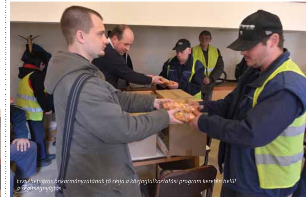
Erzsébetváros önkormányzatának fő célja a közfoglalkoztatási program keretén belül a segítségnyújtás

Mindkét önkormányzat célul tűzte ki, hogy továbbfejleszti eddig is sikeres álláskeresői tréningjeit, illetve 5%-os továbbfoglalkoztatást vállal a mintaprogramban résztvevők között, a továbbfoglalkoztatás keretében pedig