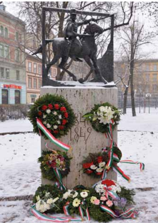
A megkoszorúzott Huszár-szobor a Klauzál téren