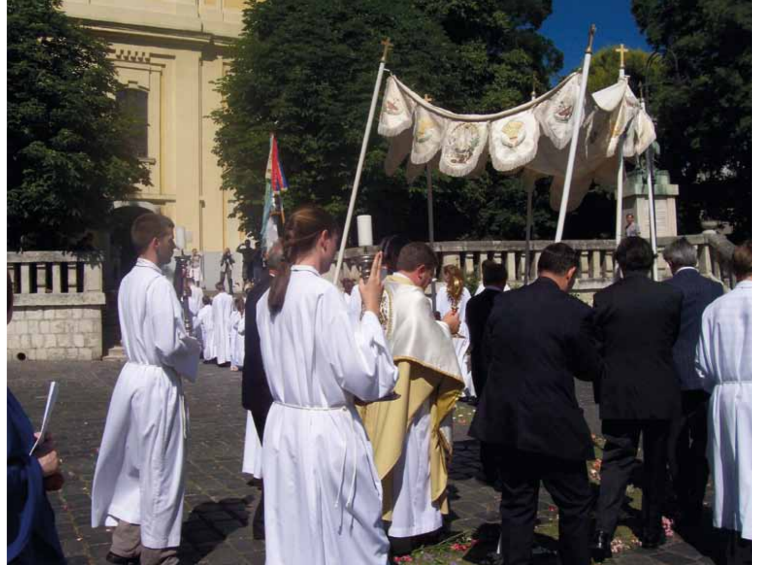
Úrnap körmenet a budafoki Szent Lipót katolikus templomnál