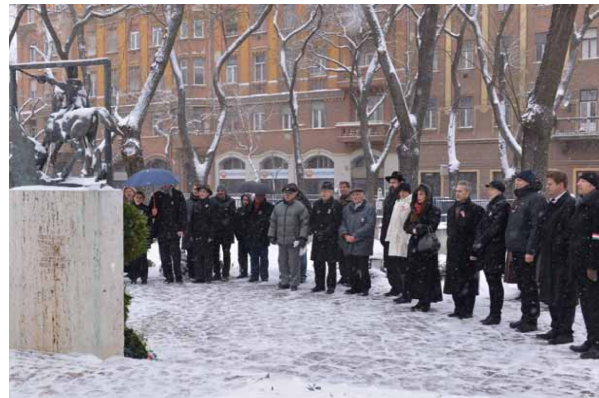
A Klauzál téri ünnepi koszorúzás az 1848/49-es forradalom és szabadságharc emlékére