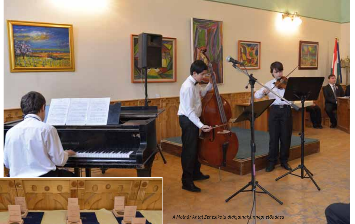
A Molnár Antal Zenesikola diákjainak ünnepi előadása